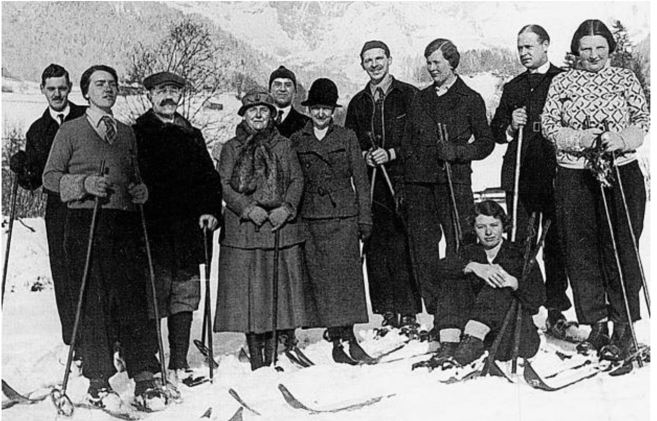
Die holländische Königsfamilie im Winter 1934 zu Gast im Hotel Sternen